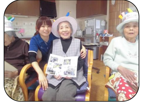
~来年もお祝いしましょう♡~