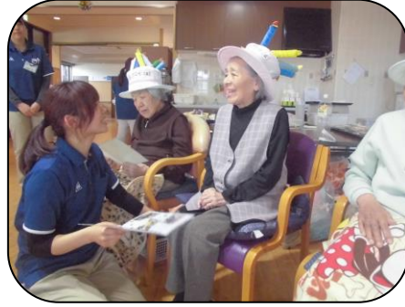
~スタッフ手作りのプレゼント~